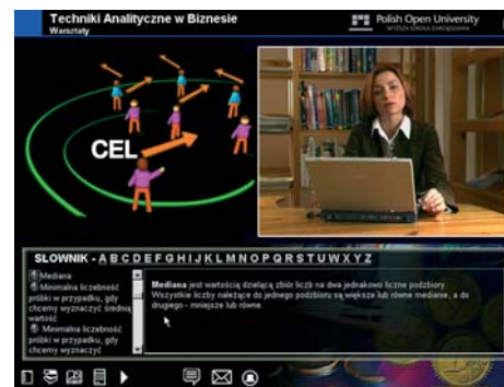
Platforma to: kontakt z wykładowcą

Student zostaje dopuszczony do egzaminu na podstawie uzyskanego zaliczenia sprawdzianu. Sprawdzenie jest pracą pisemną opracowywaną przez studenta